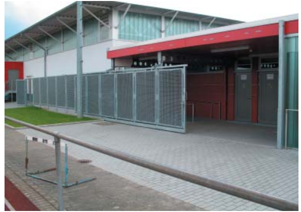
Evangelischer Kirchenraum Biebergemünd - Kassel