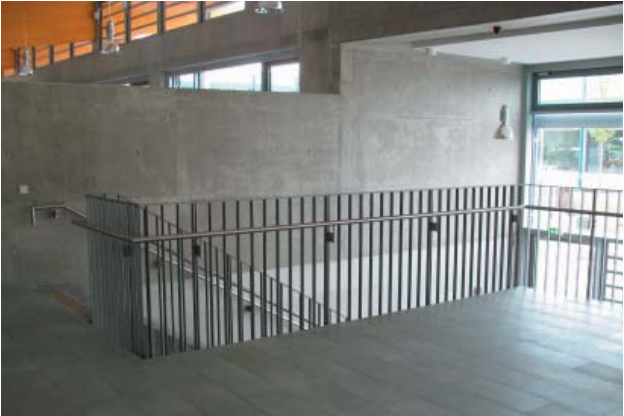
Kopernikusschule Freigericht - Somborn