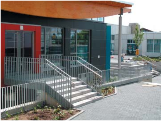
Toyota Autohaus Nix Niederlassung Offenbach